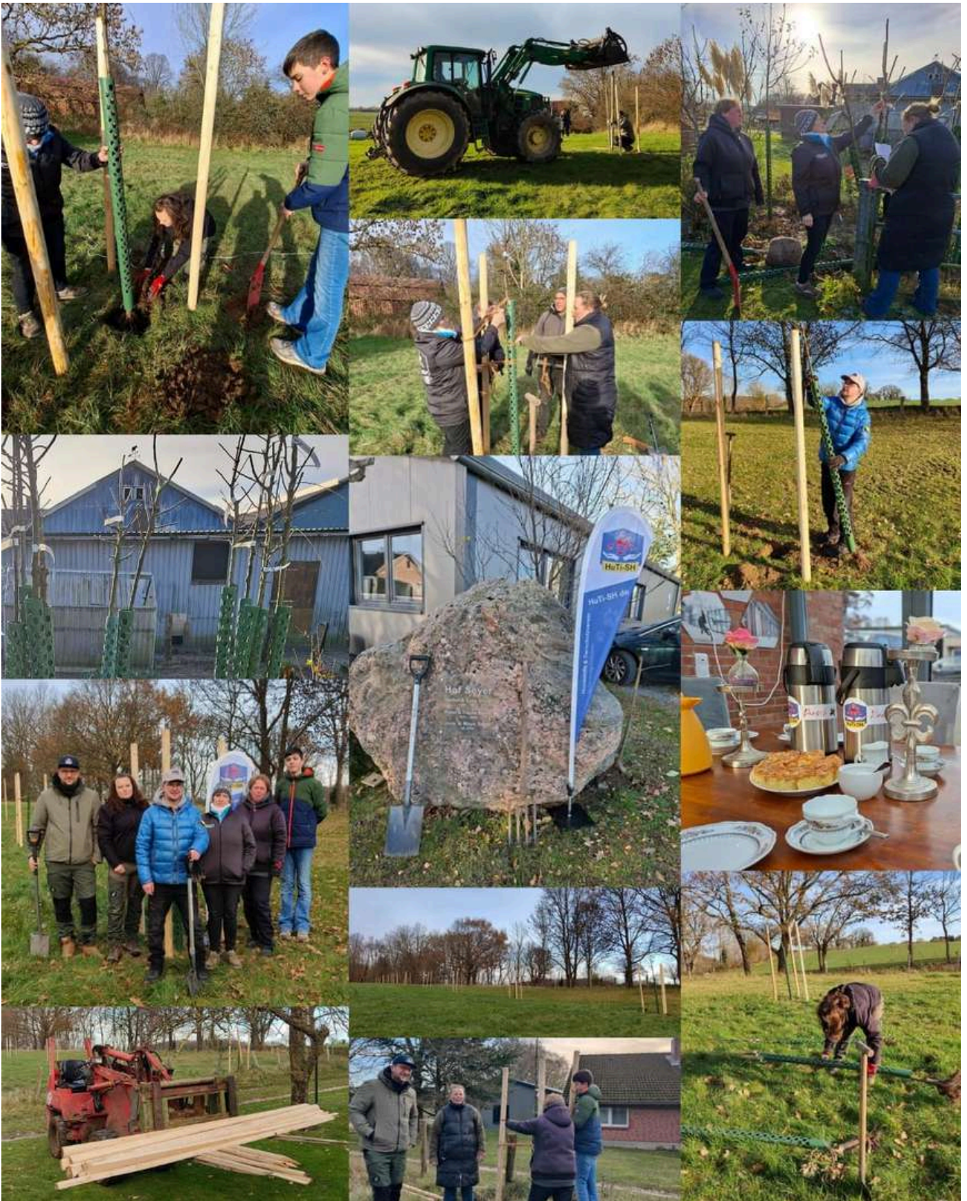
Text und Foto: Maya Seyer