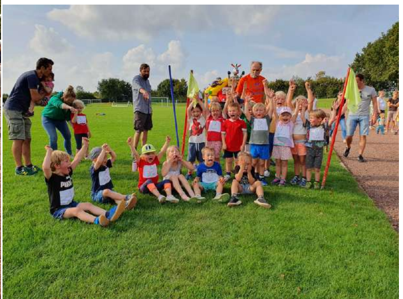
Text und Fotos Svenja Matthies