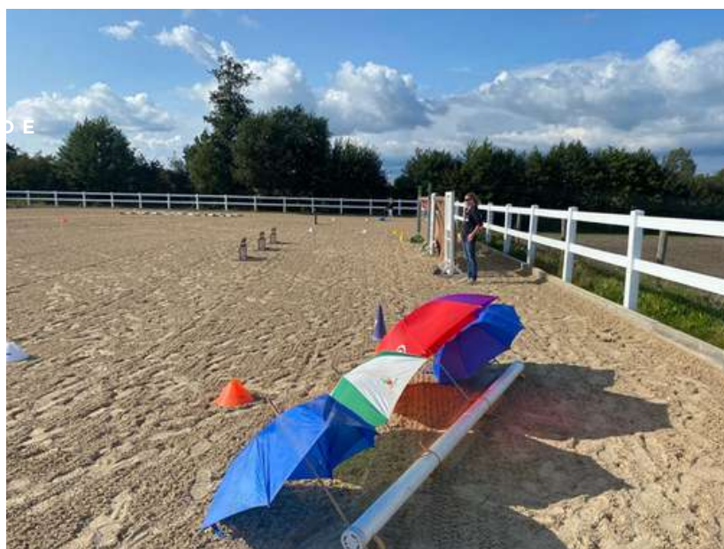
Blick auf die Prüfungsaufgaben – nicht für alle Teilnehmer ein „Spaziergang“!

Die Gelassenheitsprüfung (kurz: GHP), wurde von CAVALLO und der Deutschen Reiterlichen Vereinigung (kurz: FN) ins Leben gerufen. Die Prüfung richtet sich an alle Besitzer von Sport- und Freizeitpferden sowie an Reiter (und Fahrer) aller Stilrichtungen. Die GHP ist ein Wettbewerb, bei dem nicht die sportliche Leistung, sondern der Charakter des Pferdes/Ponys, das Vertrauen zum Pferdeführer, die Aufmerksamkeit und die Erziehung des Pferdes – eben seine Gelassenheit – zählen. Eine Basis, die jedes Pferd – egal ob rein Freizeit geritten oder im hohen Turniersport unterwegs – beherrschen sollte. Es gibt die "Geführte GHP" und die "Gerittene GHP". Eine gute Note in der GHP bescheinigt Reiter und Pferd, dass die Basis der Ausbildung stimmt. Und ob die Basis der Ausbildung stimmt, wurde am 01.09. auf Hof Kruse geprüft. So gab es auf Hof Kruse eine geführte und eine gerittene GHP. Insgesamt 15 Starterinnen und Starter fanden den Weg nach Osdorf und stellten sich Aufgaben wie: aufsteigende Luftballons hinter eine Hecke, dem Flattervorhang, dem Rappelsack, aufgespannten Regenschirmen, der Benutzung einer Sprühflasche am Pferd, sowie verschiedenen weiteren Aufgaben (über eine Brücke gehen, geschwenkte Fahnen, Windplane, Wasserplane u.v.m.). Gerichtet wurden die Prüfungen von Meike Tewes (vielen Dank an dieser Stelle an Meike, die uns auch im Vorfeld bei der Vorbereitung der Prüfungen fachlich unterstützt hat.).