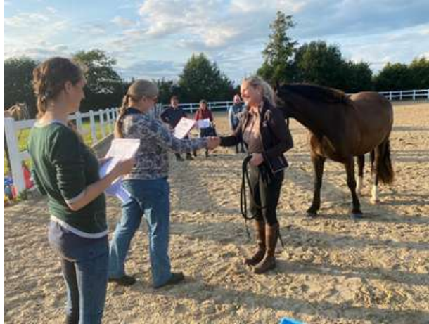
Glückliche Gesichter bei der Urkundenübergabe

Insgesamt ein tolles und sehr entspanntes Event. Jeder war für jeden und hat mitgefiebert. So soll es im Sport sein!