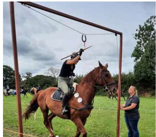
Schnell und präzise – Fähigkeiten, die beim Ringreiten durchaus nützlich sein können.