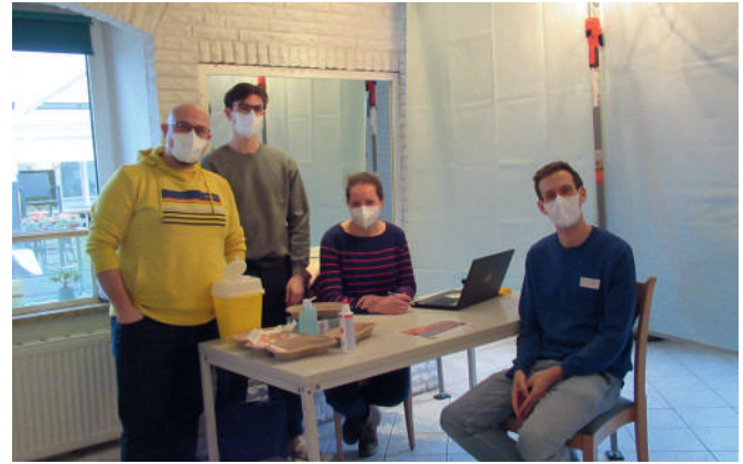
Text und Foto: Imke Petersen

keit zum Testen in der Teststation in den Gemeinderäumen der Kirche an. Aber natürlich werden die fleißigen Helferinnen auch bei der zweiten Impfaktion das Impfteam des Landes wieder unterstützen.