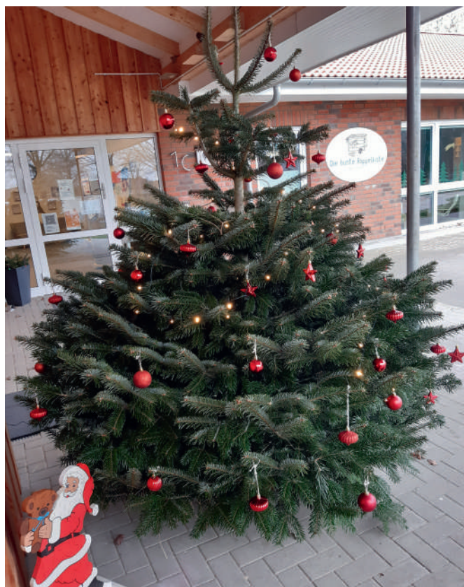
Text u. Foto: Veronika Petersen

Die weiße Weihnacht verwandelte unser Bäumchen dann zusätzlich in ein echtes Schmuckstück. Wir sagen Danke an das Gut Augustenhof!