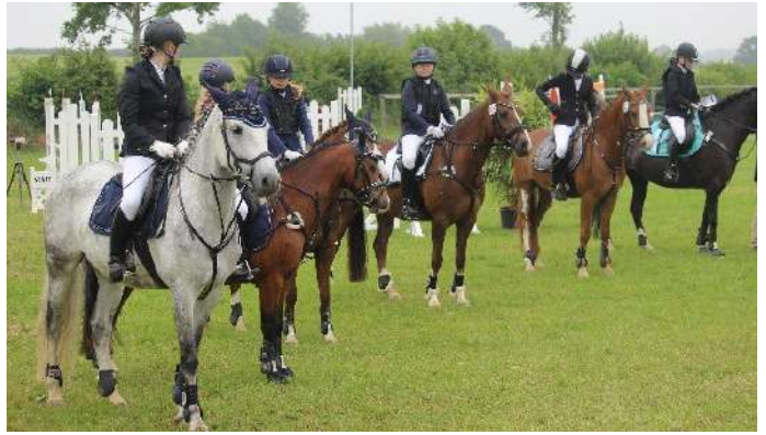
Strahlende Gesichter: Der Siegerin und Platzierten der Pony-Stilspring-Prüfung.

Text: Claudia Müller