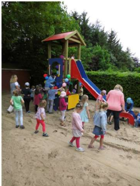
... Juhuu ...endlich