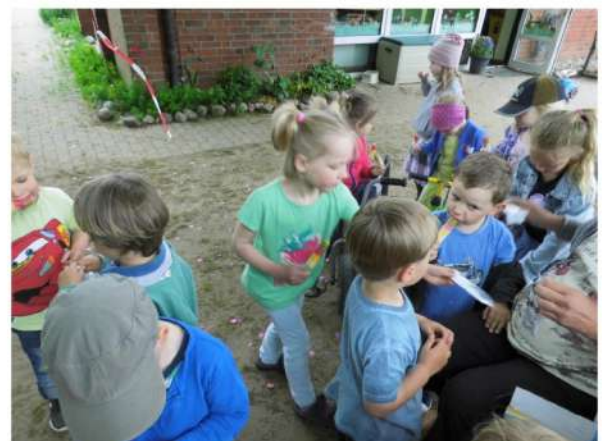
und am Ende gabs noch ein Eis