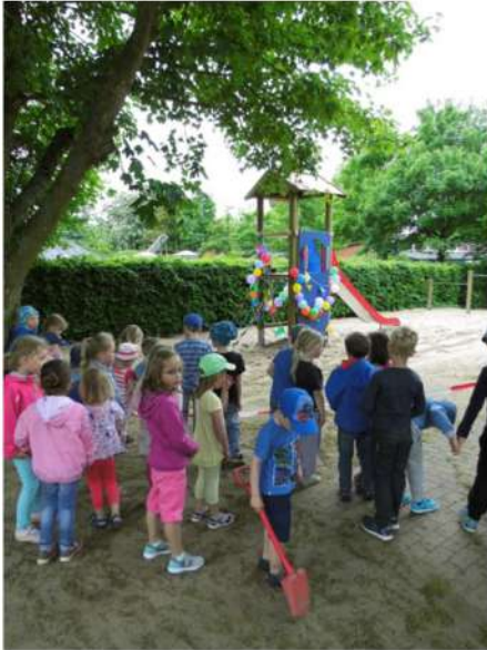
Gleich geht's loos...