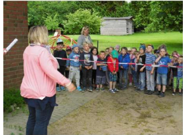
... letzte Hinweise