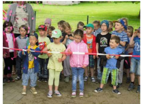
wie bei den Großen.... das Absperrband durchschneiden